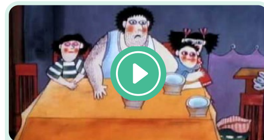
(4127) The Impossible Dream -