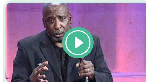
Sous-titres français disponibles