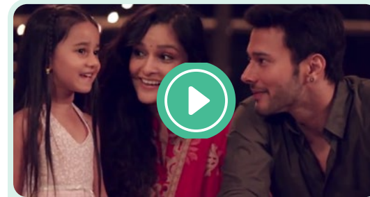
Women's Safety Begins at Home

Montrez la vidéo Women's Safety Begins at Home (« La sécurité des femmes commence à la maison ») à partir du lien ci-dessous (en anglais) et discutez de la façon dont les enfants apprennent de leurs parents qu'il est acceptable de brutaliser les femmes. Expliquez aussi que nous devrions enseigner à nos fils à respecter les femmes et les filles, et que la sécurité des femmes commence à la maison.