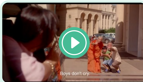
« Les garçons ne pleurent pas »

Montrez les deux vidéos suivantes et discutez du contenu en groupe après chaque vidéo (les vidéos sont en anglais) :