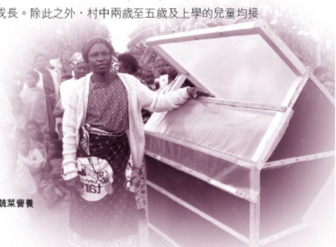
「太陽能乾菜機」能貯存蔬菜營養

加拿大世界宣明會在馬拉維貧窮村民中過去十年樹木「扶貧項目」的美好成果，其中不同伙伴的齊心合作，為村民進行的適當建設，及對基本村民的健康改善，深印在我心。願加拿大善心人士繼續慷慨解囊，支持世界宣明會在世界不同地區的扶貧項目，讓在困境中生活的人，特別是弱小的兒童，可以健康地成長，發揮天賦的潛能，活出豐盛的人生。